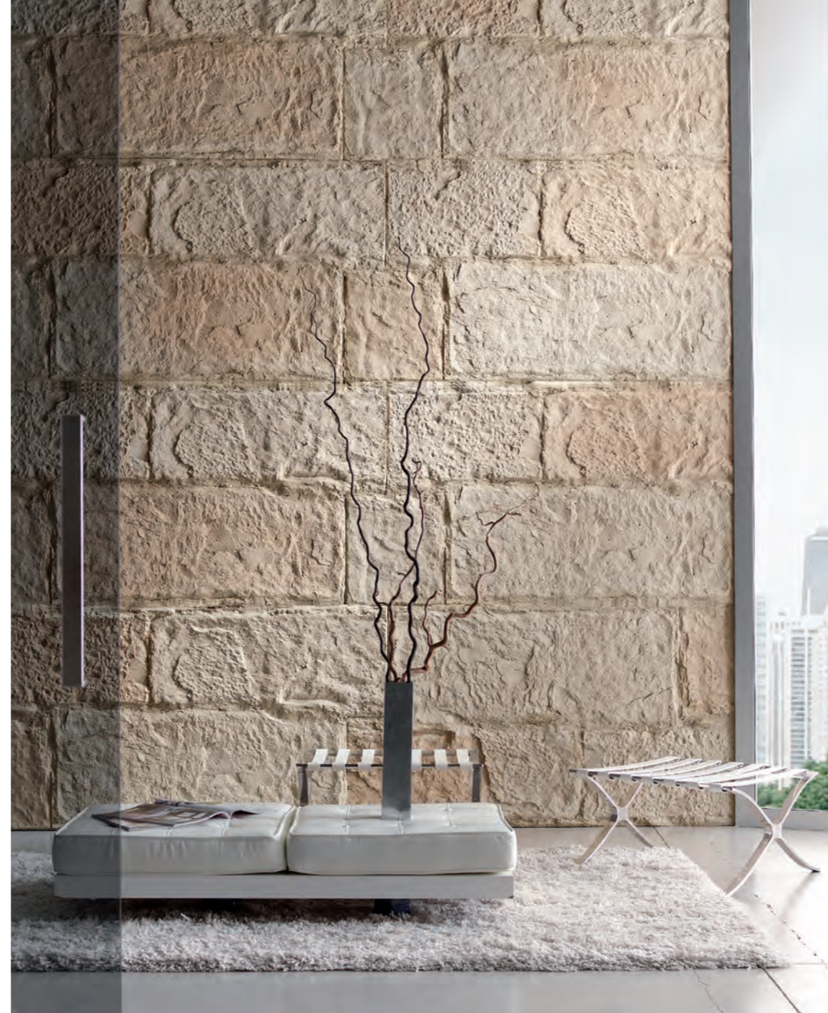
PR 170 Ocre